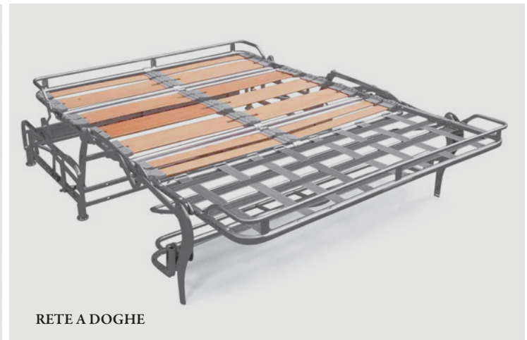
RETE A DOGHE