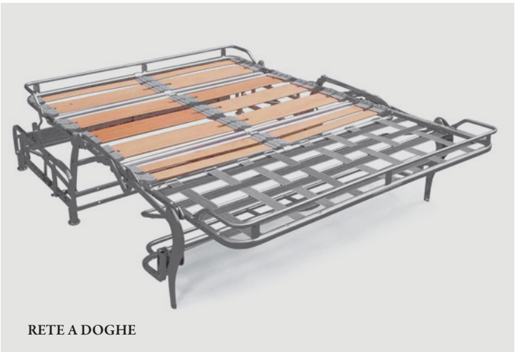
RETE A DOGHE